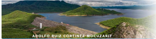
ADOLFO RUIZ CORTINEZ-MOCUZARIT