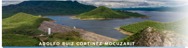
ADOLFO RUIZ CORTINEZ-MOCUZARIT