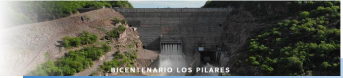
BICENTENARIO LOS PILARES