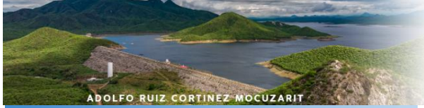
ADOLFO RUIZ CORTINEZ-MOCUZARIT