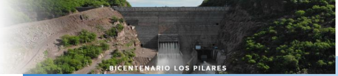
BICENTENARIO LOS PILARES